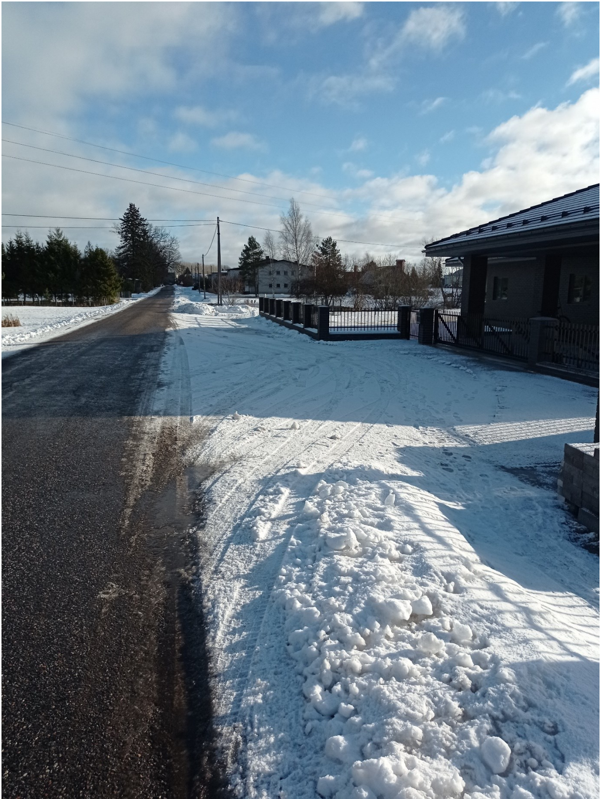
Joonis 3. Juurdepääs riigiteelt Tiigi tn 11a kinnistule, tänavavaade 05.02.2024